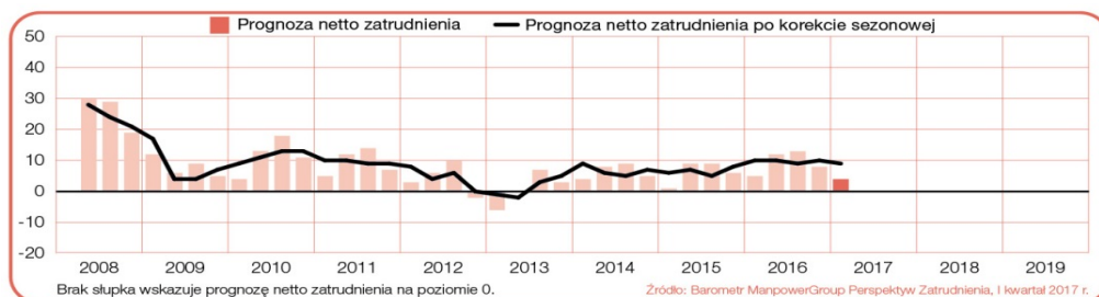
Wykres 1. Prognoza netto zatrudnienia dla Polski w ciągu kolejnych kwartałów. Źródło: „Barometr ManpowerGroup Perspektyw Zatrudnienia”.